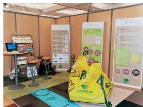
Le stand Optimum by uftm, congrès l'UNRST-FFB.

L'UFTM et l'UNRST-FFB, qui ont conçu le programme Optimum by uftm, ont la volonté de créer une association ayant pour but sa promotion auprès des différents acteurs de la profession.