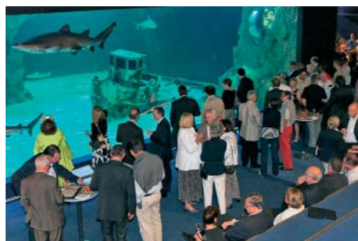
L'Océarium - Le Croisic

CITÉ BÂTISSEUR Clermont-Ferrand 28/9/2010 - 1/10/2010 Nancy 20/10/2010 - 23/10/2010