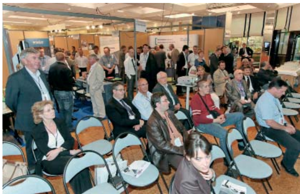
Auditoire des ateliers techniques.